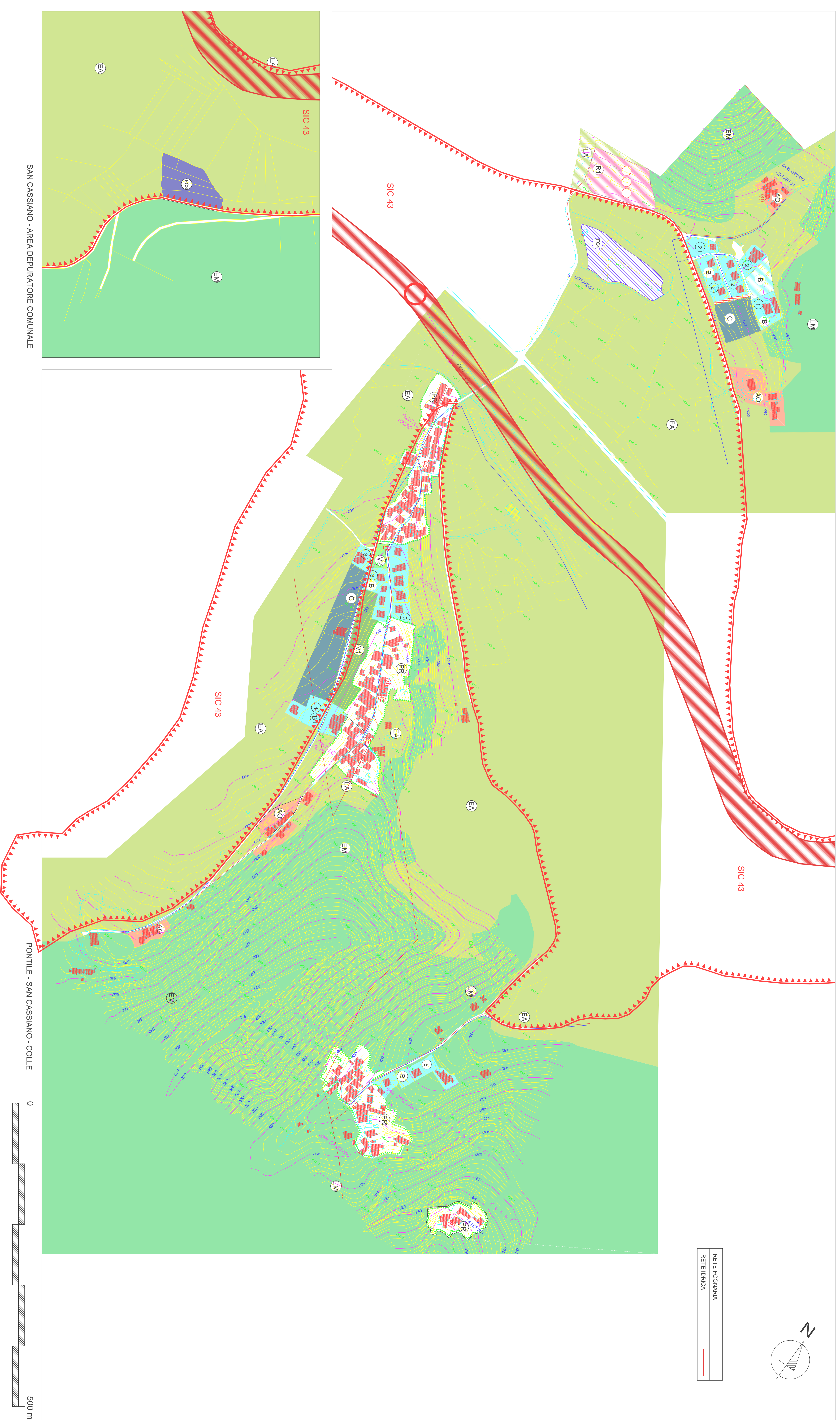
SAN CASSIANO - AREA DEPURATORE COMUNALE